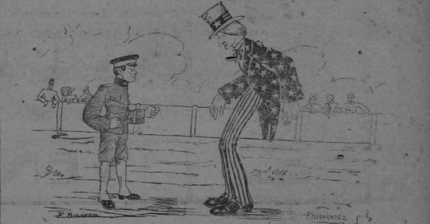
El conflicto entre Estados Unidos y el Japon.—Los japoneses están dispuestos también a "persuadir" a Uncle Sam de que la inmigración amarilla es sospechosa.