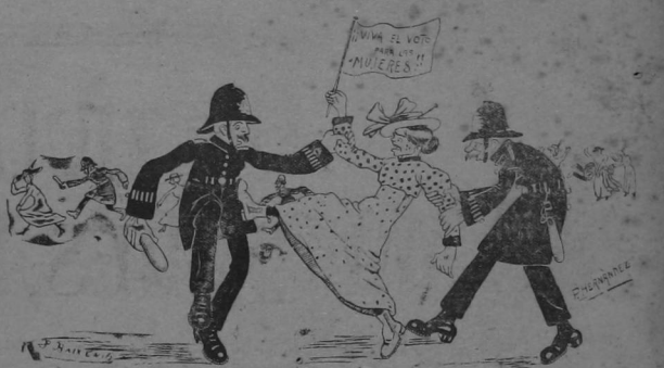
Las señoritas inglesas están resueltas a persuadir al Gobierno Británico con dulces y femeninos argumentos, de que ellas también deben votar.